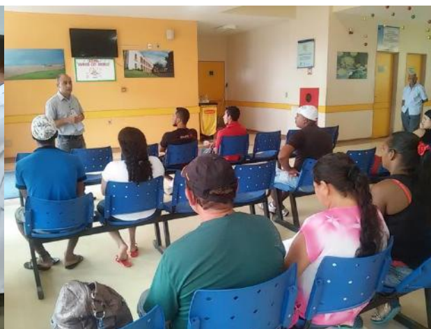
Recepção da Emergência