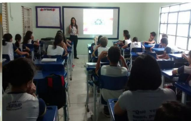
Palestra na Escola Mun. Guaraci Mendes