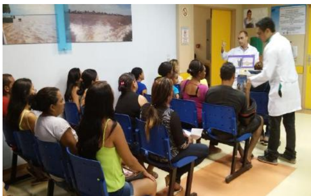
Recepção da Emergência