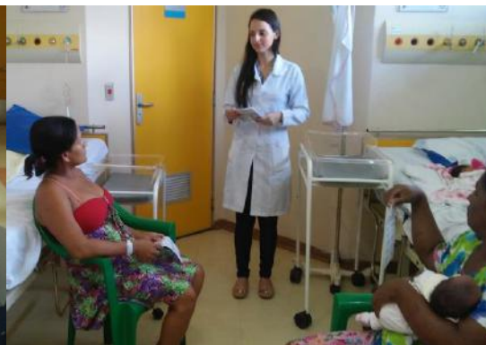
Puérperas recebem orientação sobre alimentação saudável e importância da alimentação correta aos recém-nascidos