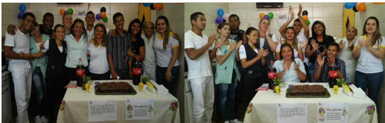
Colaboradores do HGT