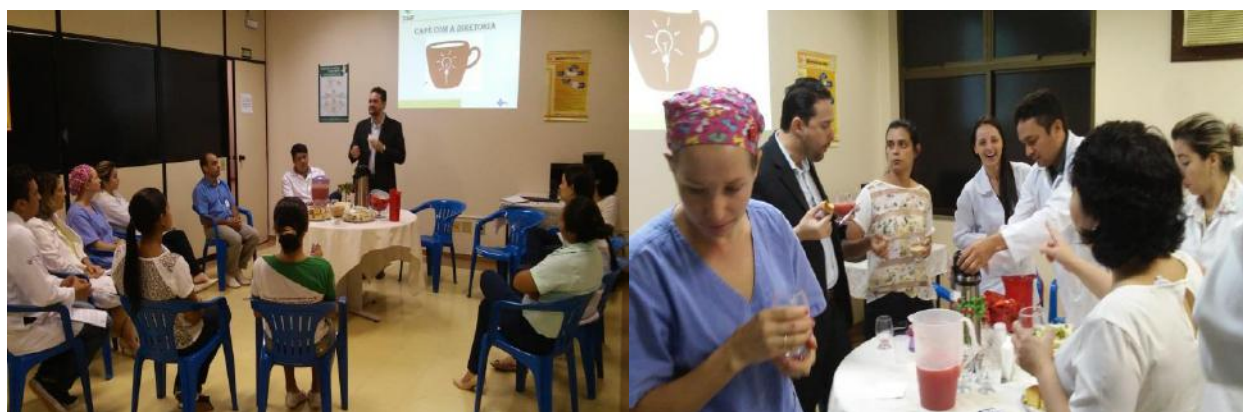
Auditório do HGT