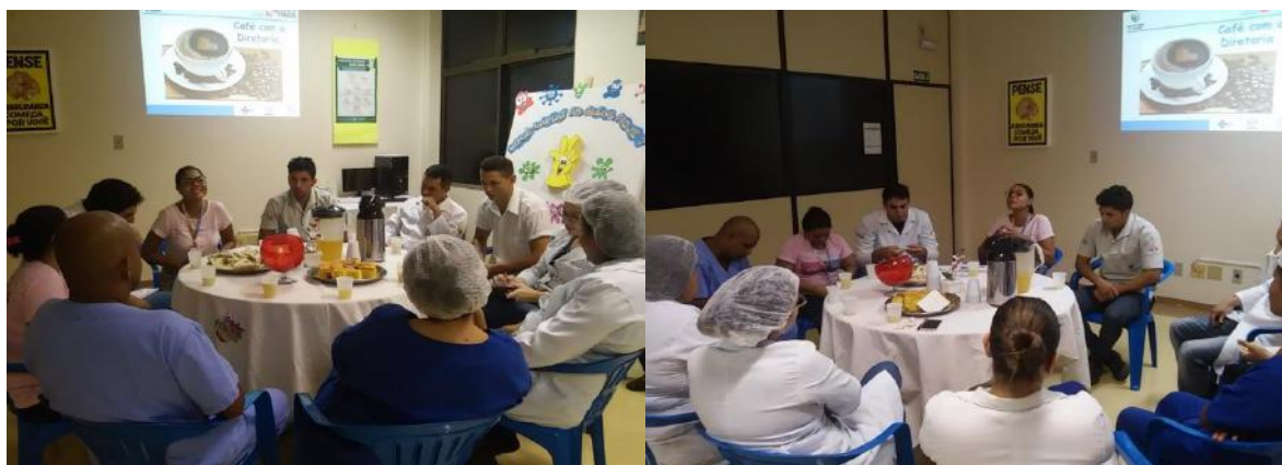
Encontro Café com a diretoria