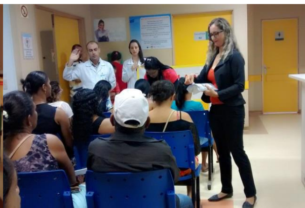
Recepção do Ambulatório