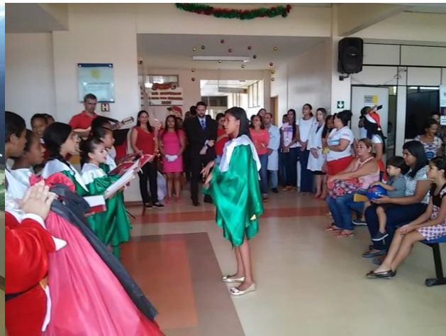
Apresentação do coral da escola