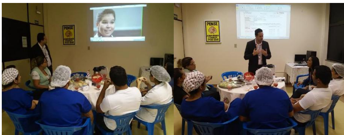
Diretor Executivo e os colaboradores.