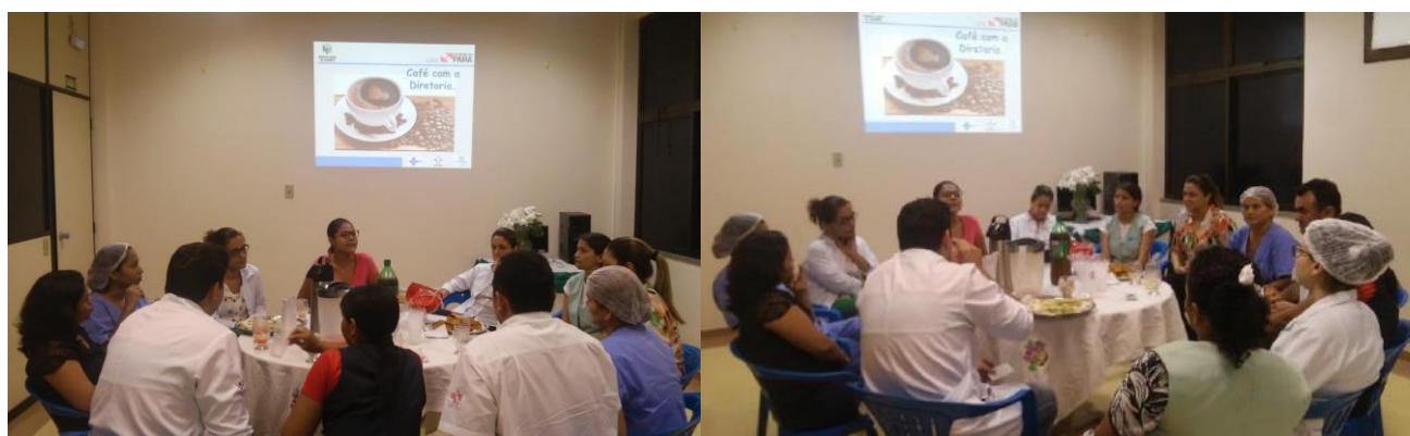
Diretoria Administrativa e de Enfermagem e os colaboradores