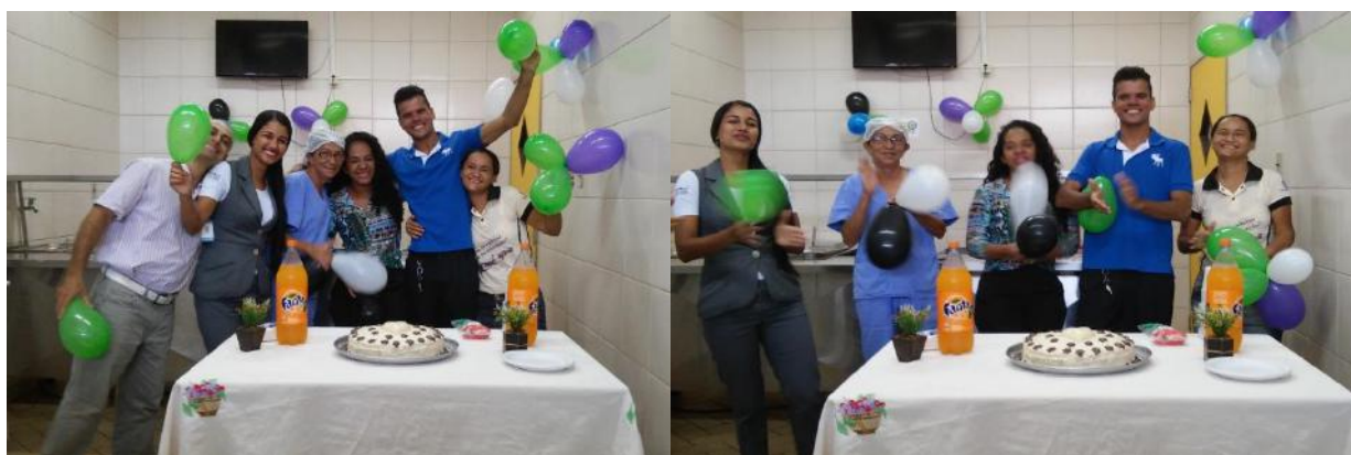
Colaboradores participam da comemoração do seu aniversário