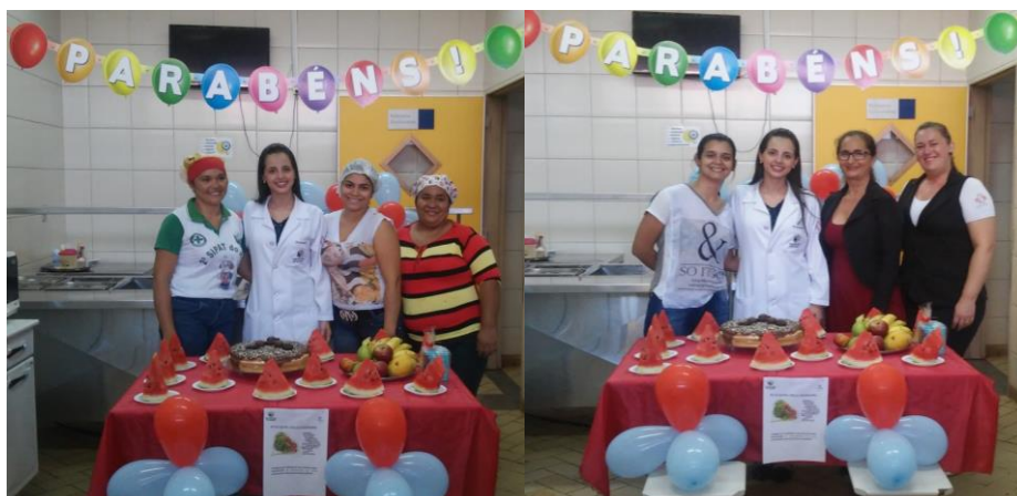
Refeitório do hospital