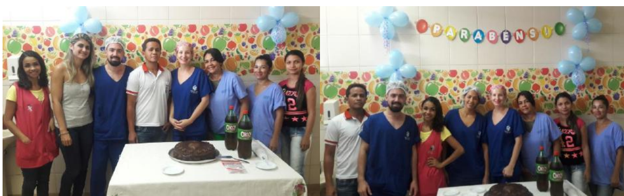
Comemoração dos aniversariantes do mês de outubro