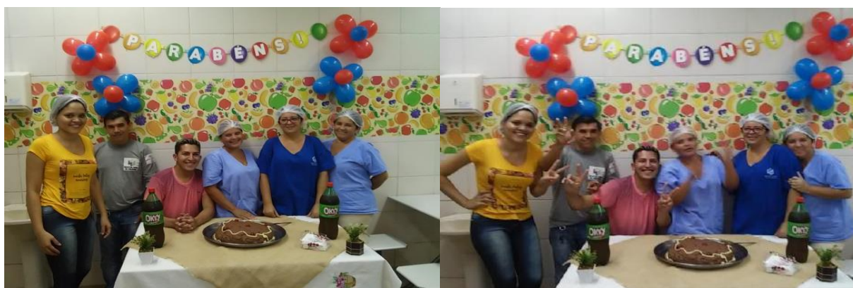
Aniversariantes do mês de dezembro de 2016