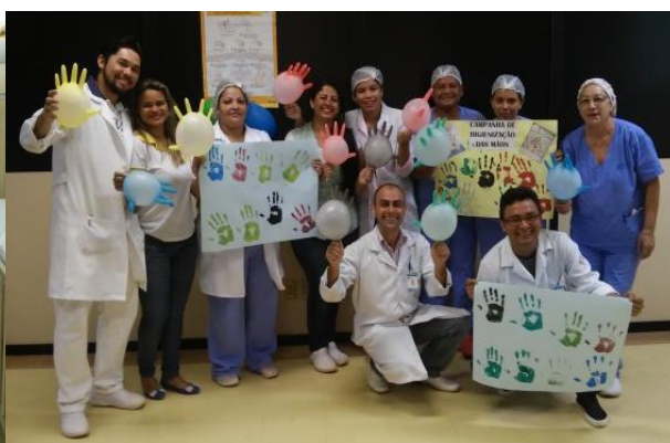
Colaboradores apoiam a campanha de Higienização das mãos