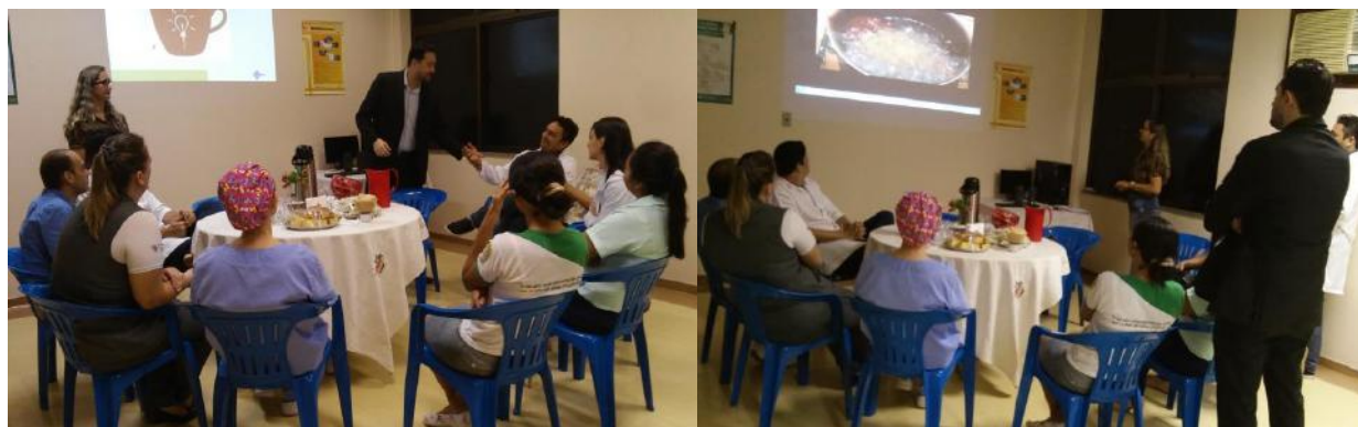
Encontro Café com a Diretoria