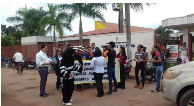
População apoia a Blitz contra a Dengue