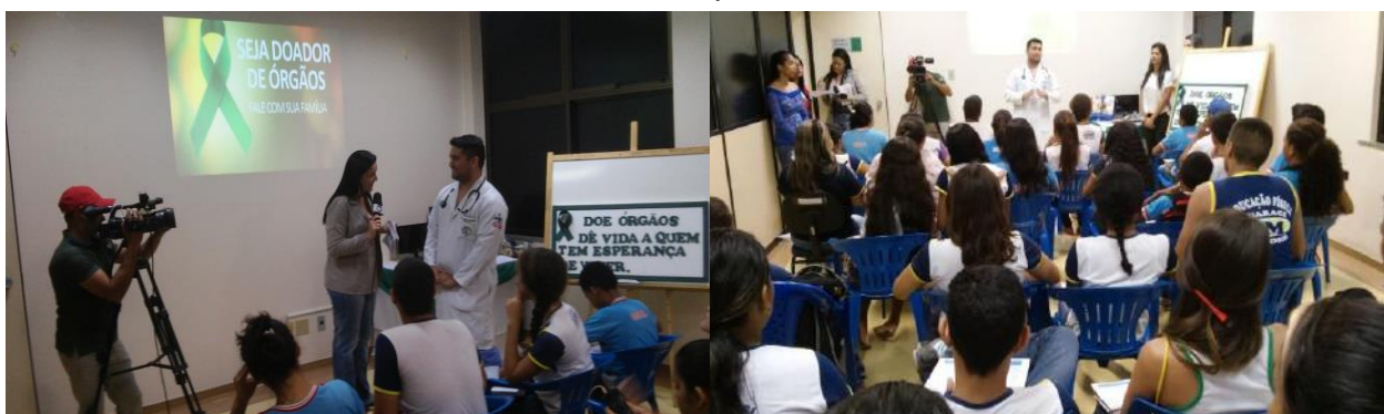
Palestra no auditório do hospital com alunos e professores