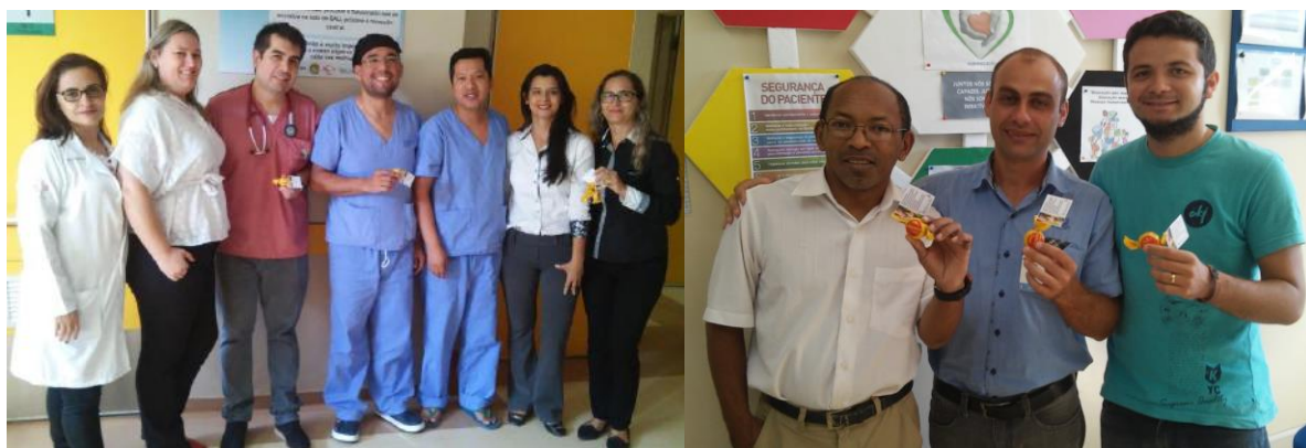
Pais e membros de GTH