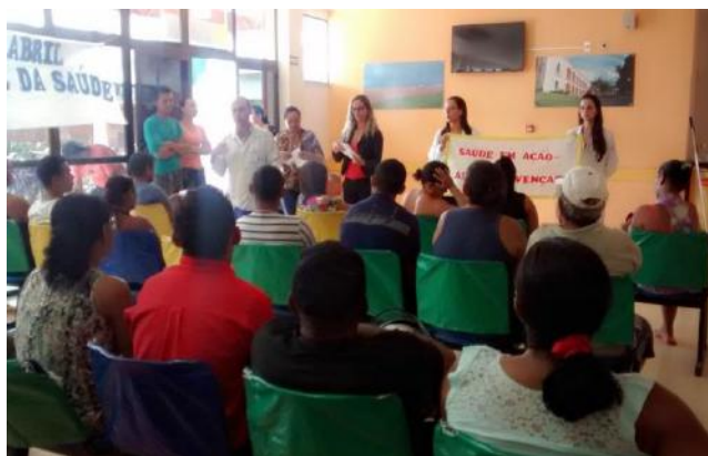
Recepção da Emergência