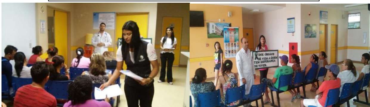
Palestras nas recepções: Ambulatório e Emergência