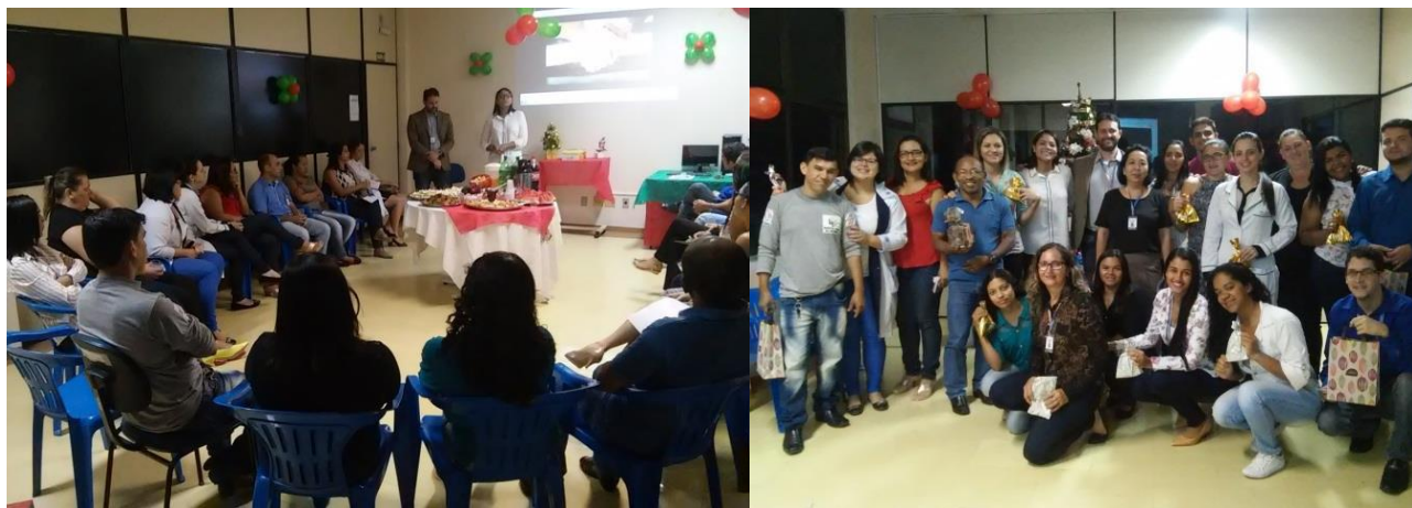
Encontro Café com a Diretoria do mês de Dezembro