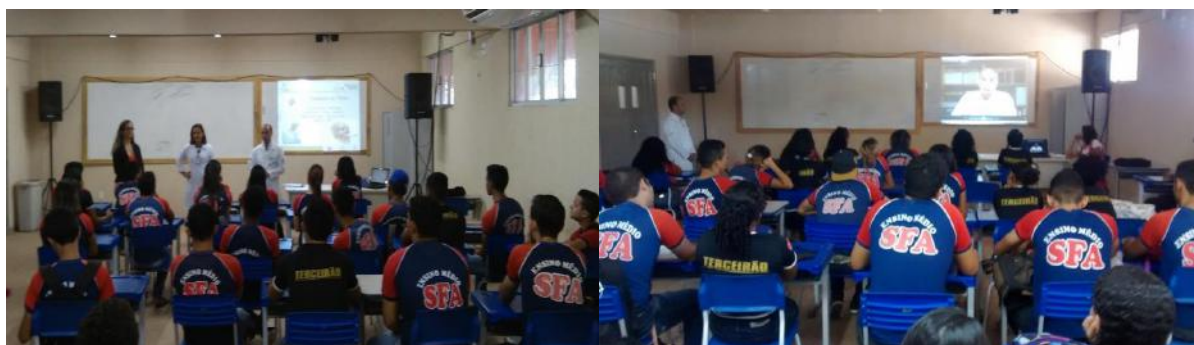
Alunos da E.E. de Ensino Médio São Francisco de Assis