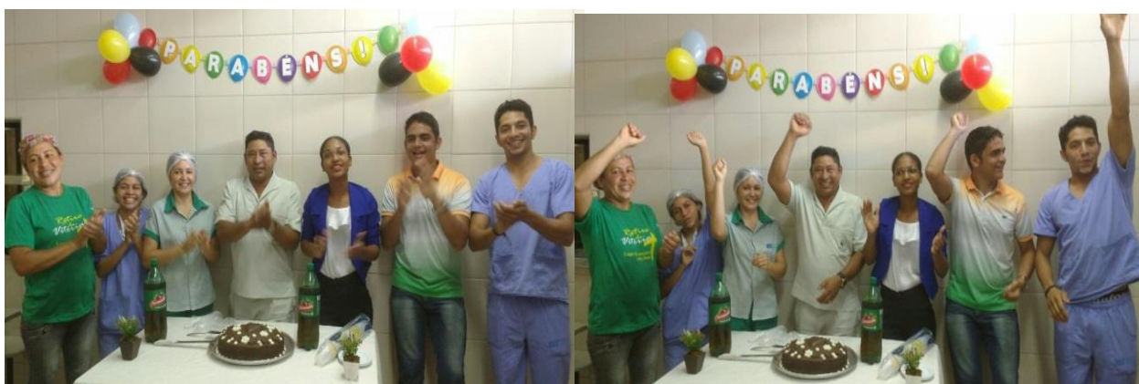
Colaboradores participam da comemoração do seu aniversário