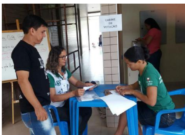
Processo de votação