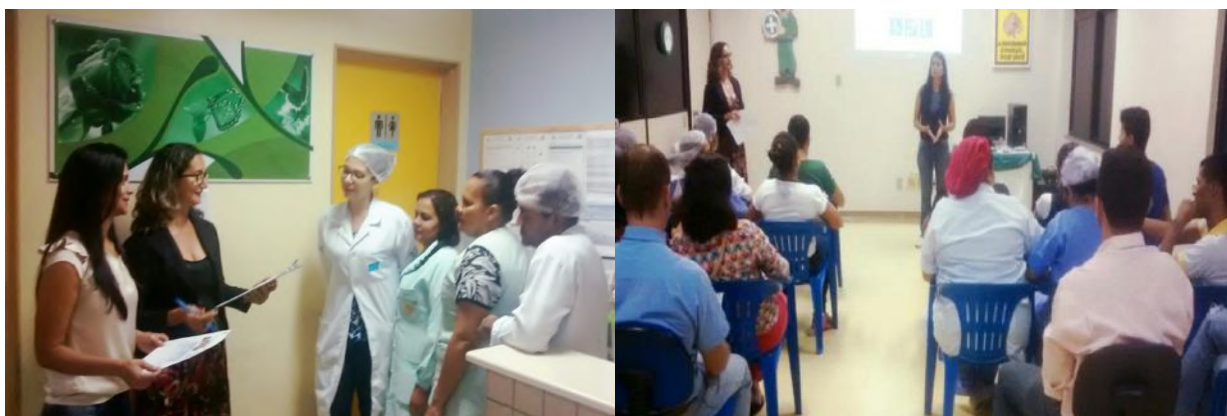
Colaborares recebem informações