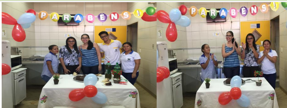
Homenagem aos colaboradores