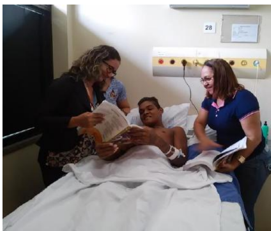
Pedagoga do HGT e diretora da escola.