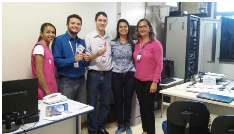
Colaboradores da TI e membros do GTH – Dia 19