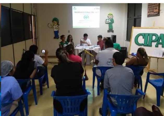
Apuração dos votos