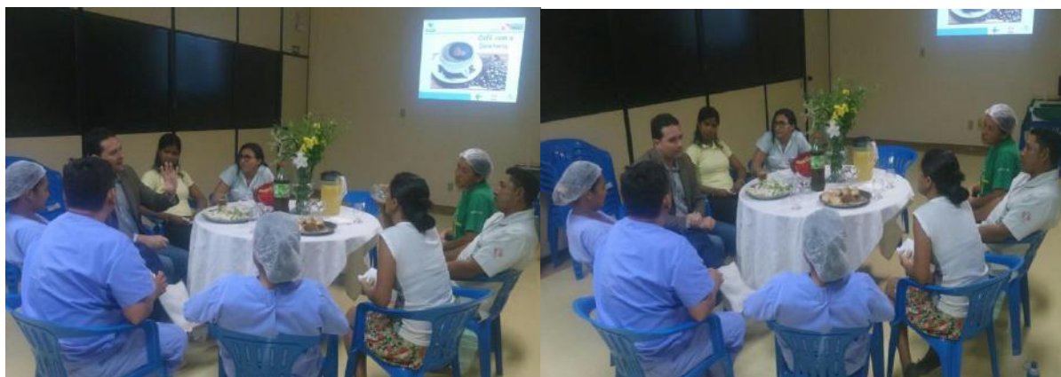
Diretor Executivo e os colaboradores