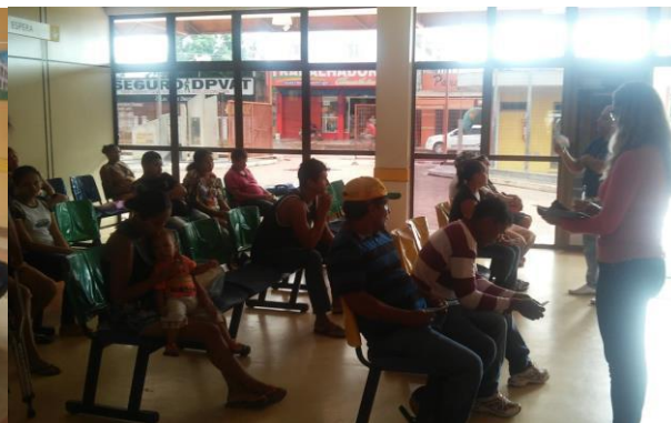
Palestras na Recepção da Emergência