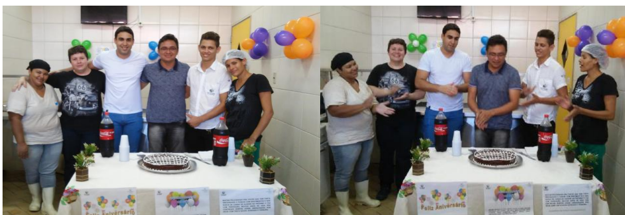
Aniversariantes do mês de fevereiro