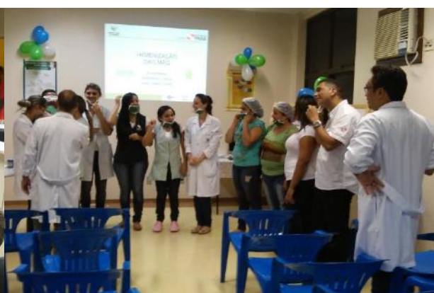
Colaboradores no treinamento de teoria e prática. Higienização das Mãos