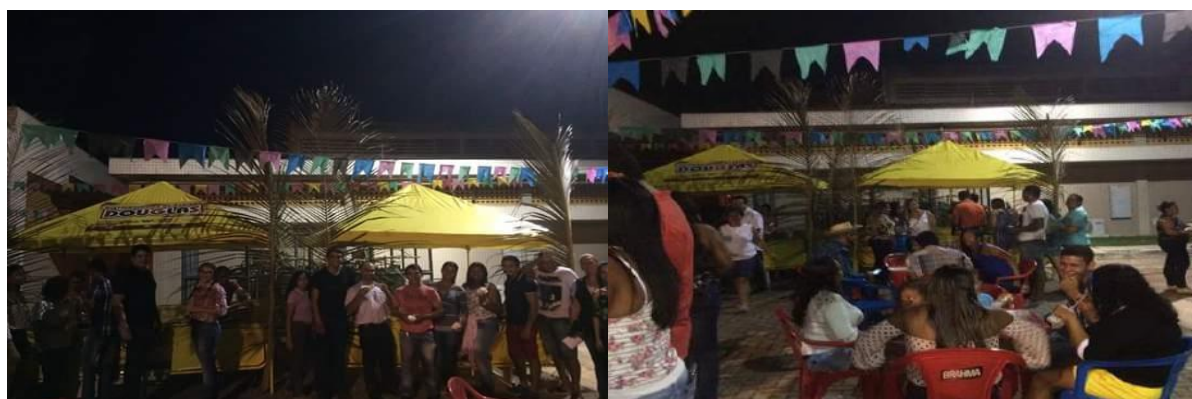
Área de estacionamento do HGT