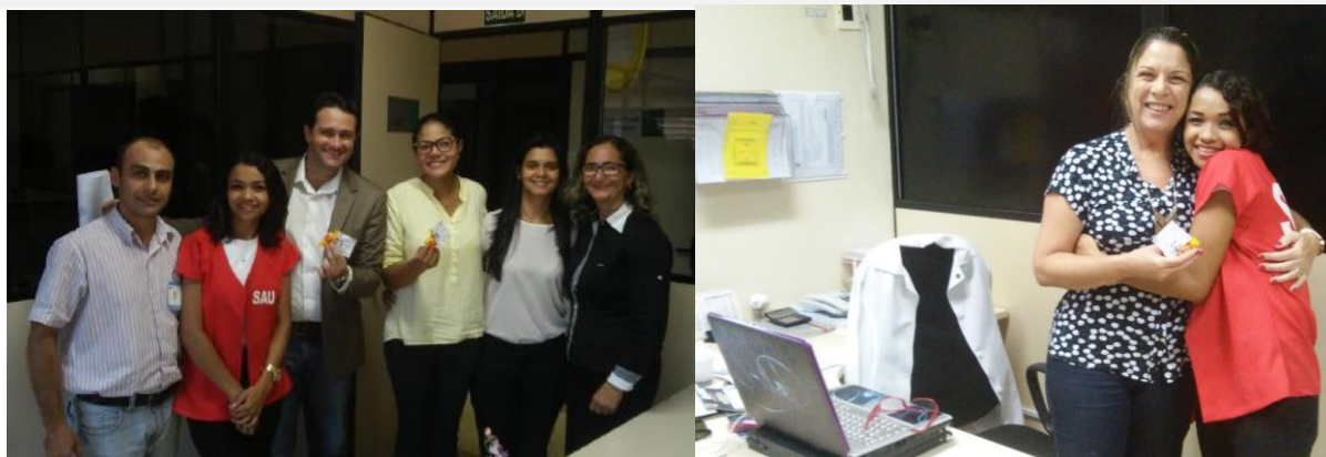
Momento da Homenagem