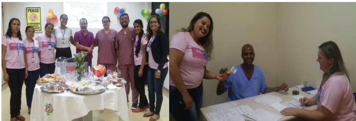
Homenagens aos Médicos – Dia 18