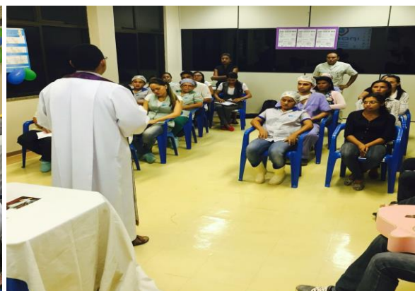
Momento de oração com colaboradores e usuários.