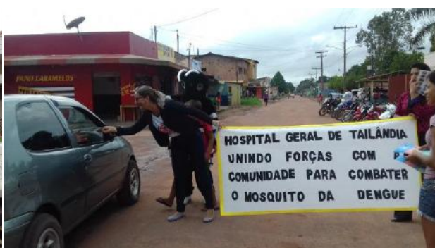
Abordagem no trânsito com entrega de panfletos