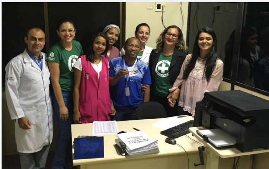
22 – Dia do Contador