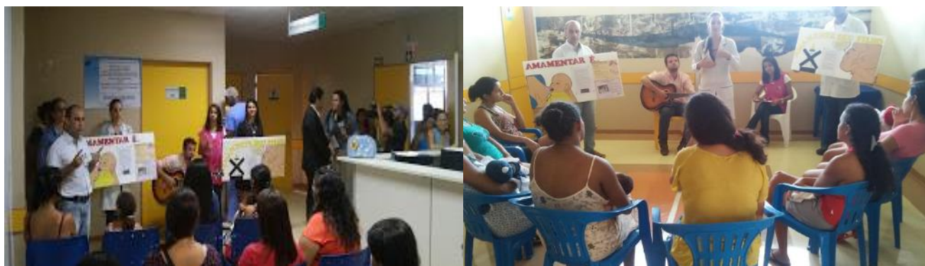
Recepção e Clínicas Integrada