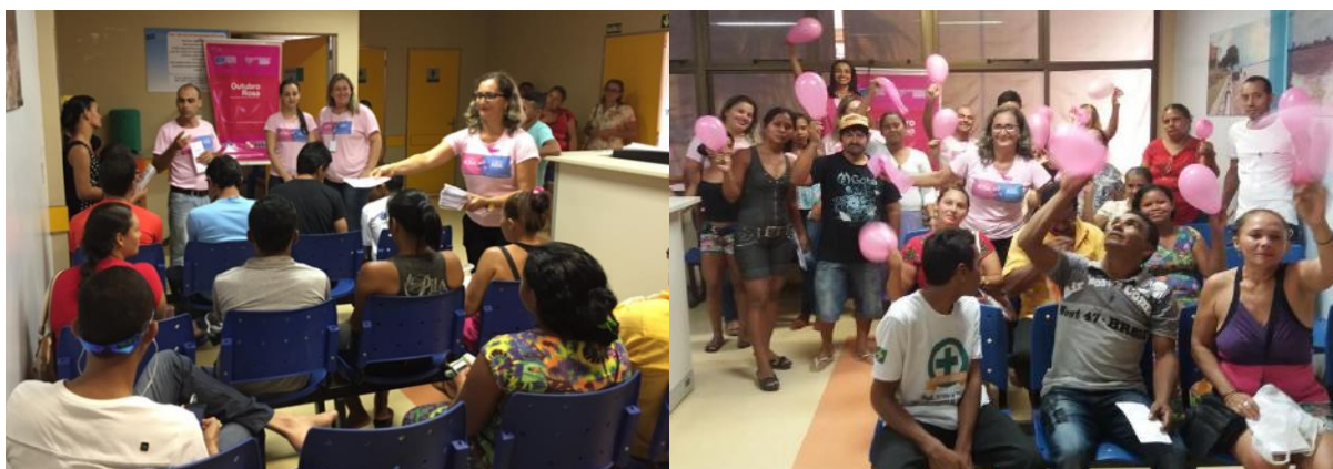
Recepções do HGT