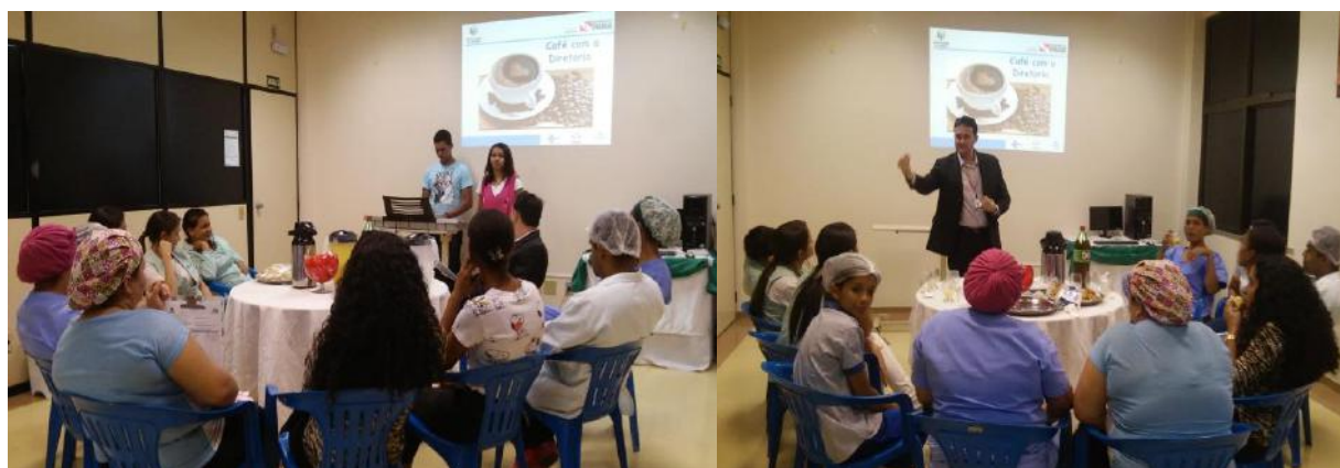
Diretor Executivo e os colaboradores no encontro Café com Diretoria