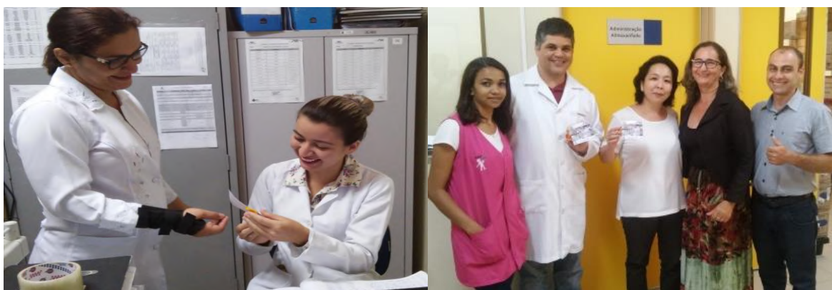
25 – Dia Internacional do Farmacêutico