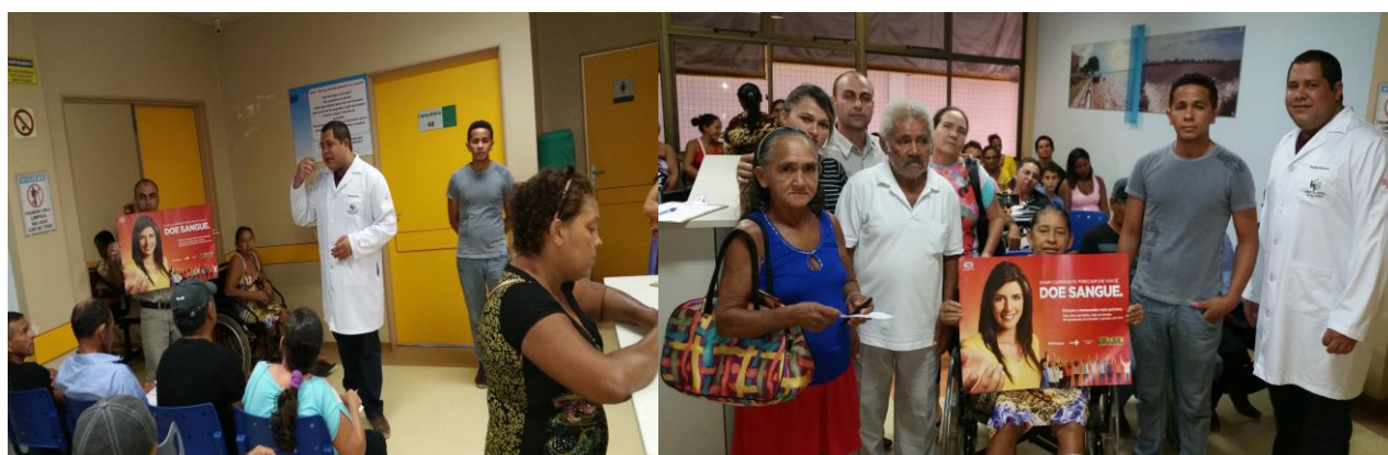
Recepções do HGT