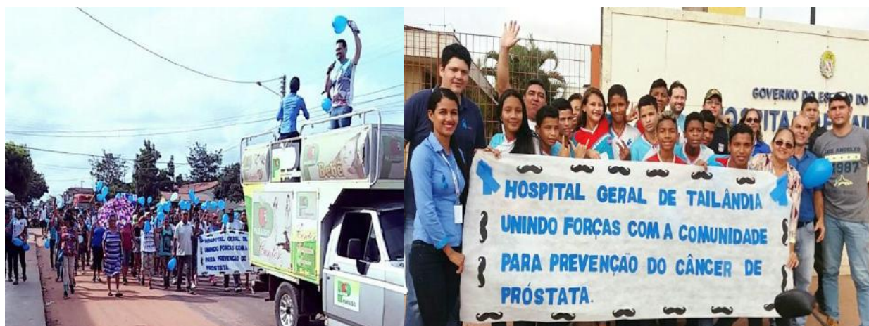
Caminhada Novembro Azul