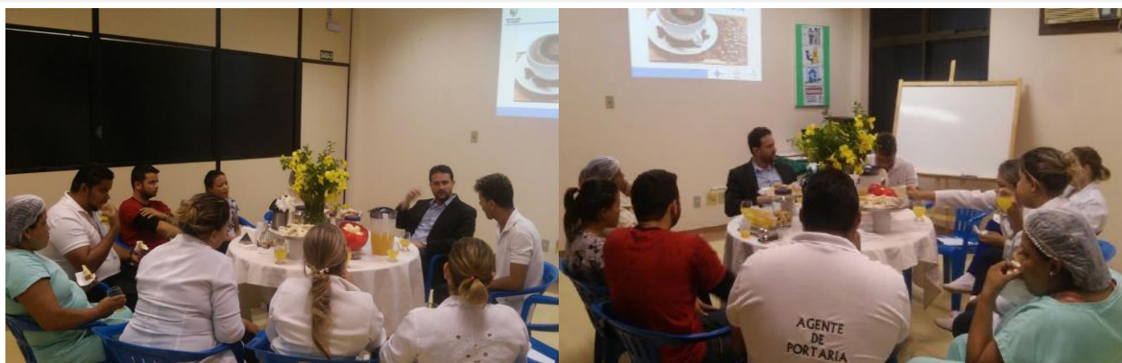
Encontro Café com a Diretoria