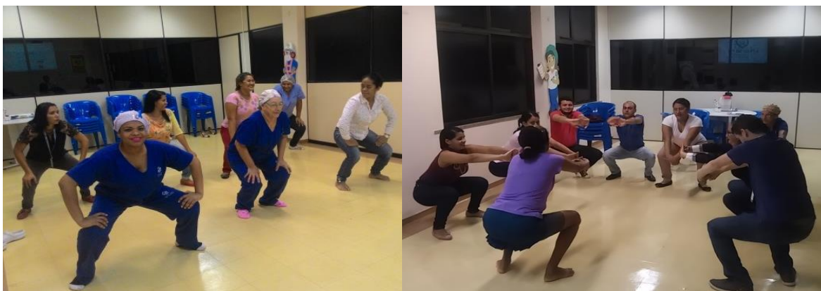
Ginástica laboral no auditório do HGT