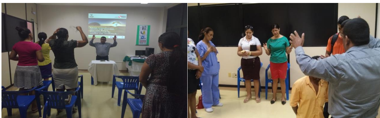
Usuários e colaboradores