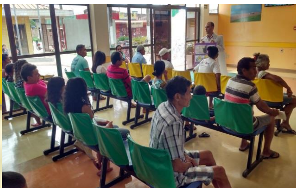
Recepção do ambulatório