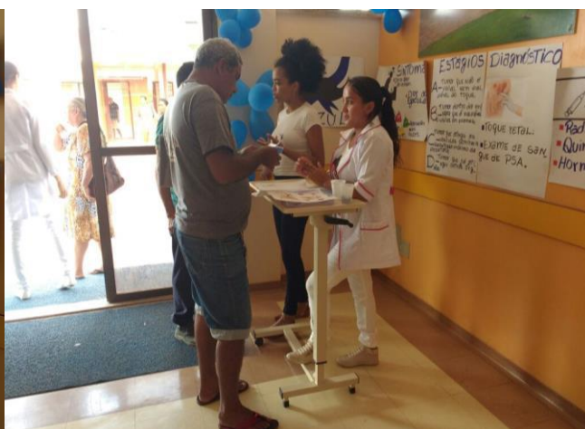
Prevenção das DST's, Câncer de próstata e entrega de preservativos.