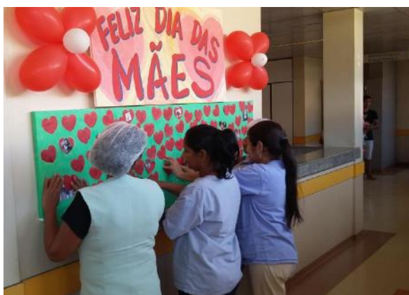
Colaboradoras do HGT