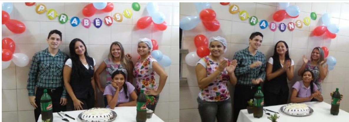
Colaboradores participam da comemoração do seu aniversário