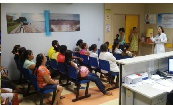
Recepção do ambulatório