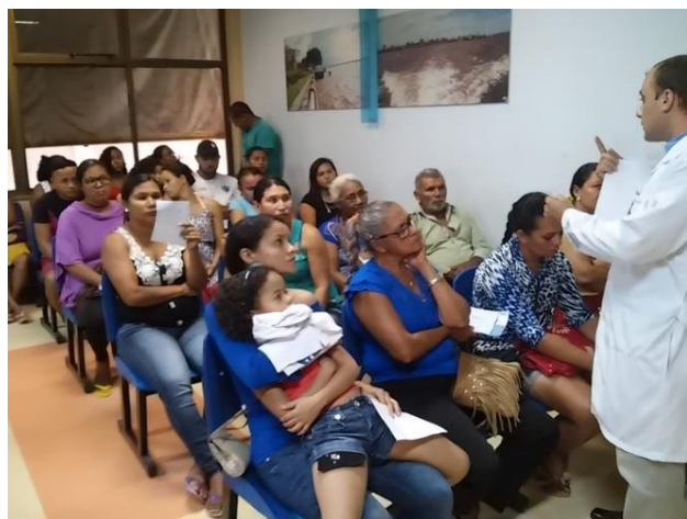
Recepção do Ambulatório