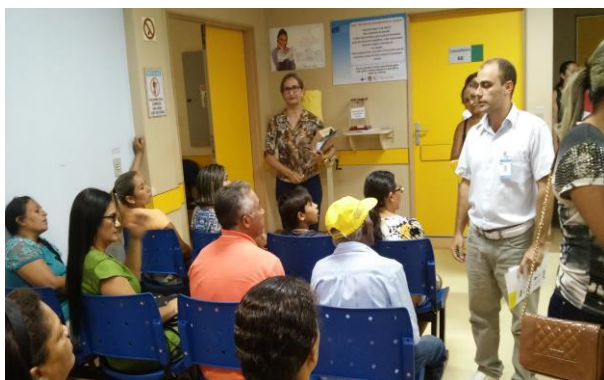
Palestra na recepção do ambulatório