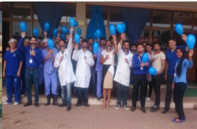
Colaboradores do HGT apoiam a Campanha Novembro Azul.