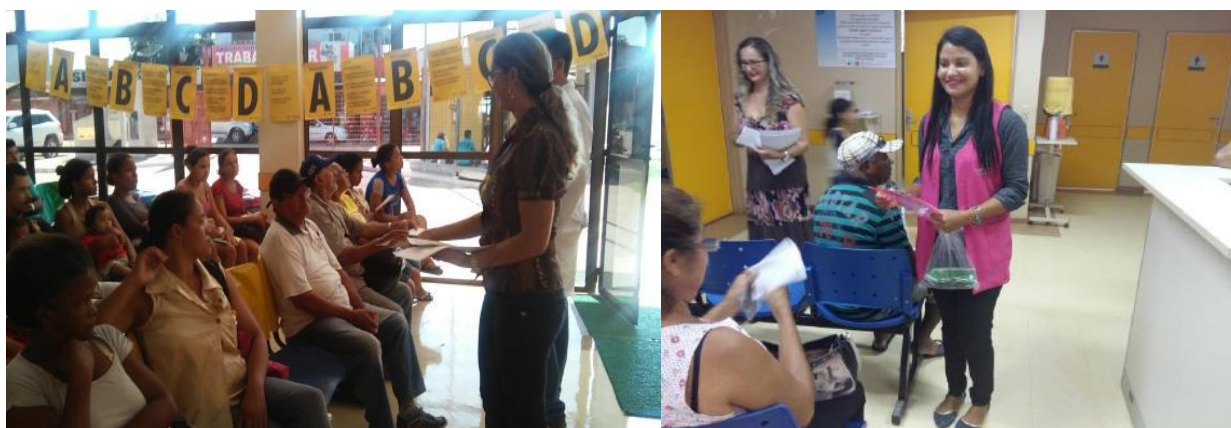
Palestras Educativas de Prevenção as Hepatites Virais e DST's