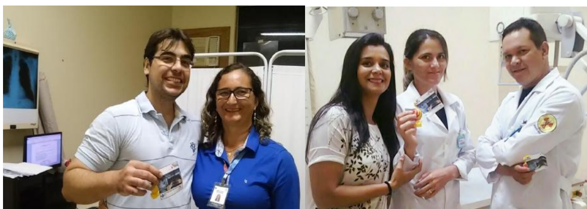
Membros do GTH entregam as homenagens aos colaboradores – Dia 08