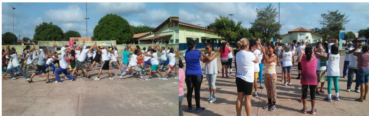
Praça da Bíblia