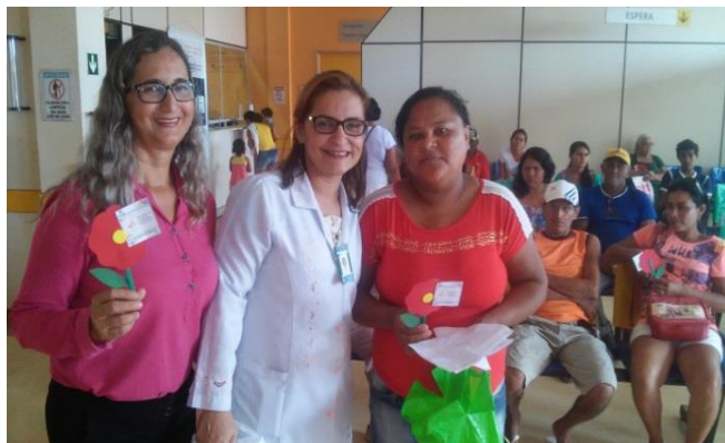
Entrega de flores e mensagens para mulheres na recepção da Emergência