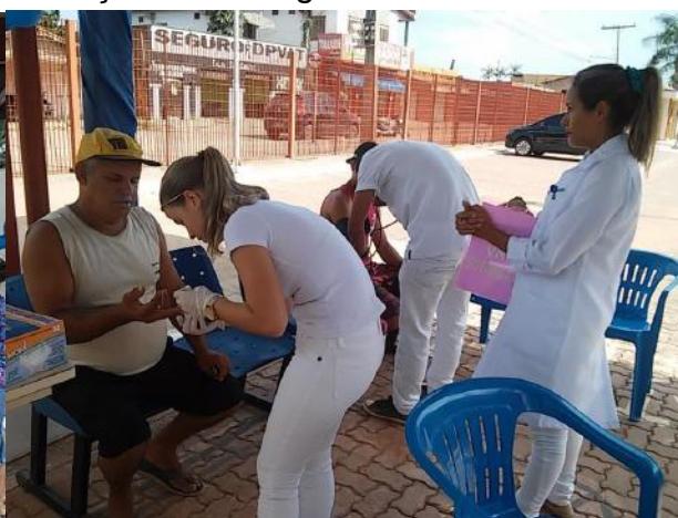
Teste de glicemia e aferição de pressão arterial no Hall do hospital