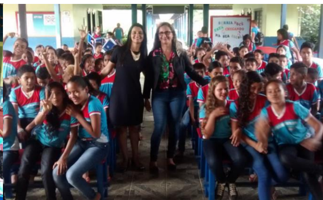
Momento de descontração com alunos