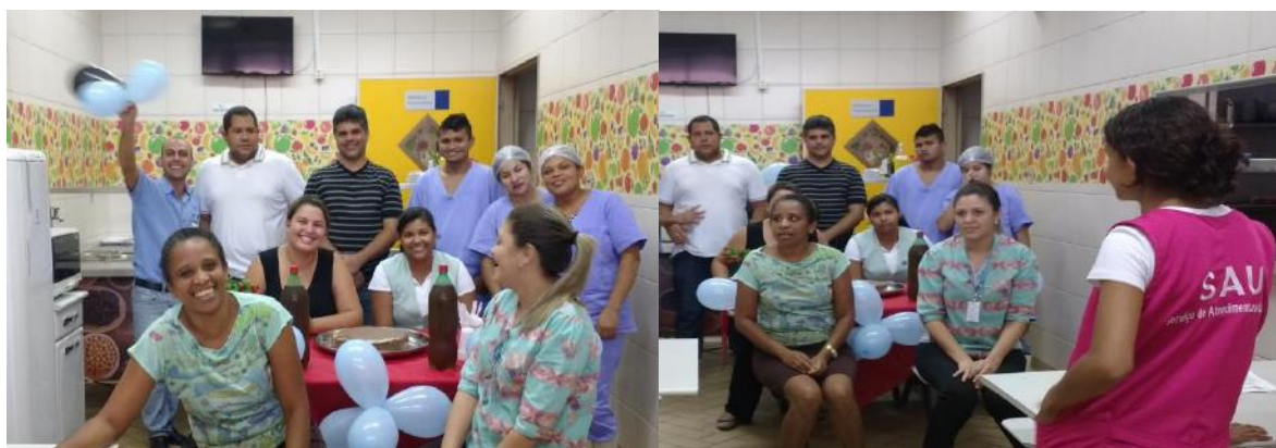
Homenagem dos aniversariantes