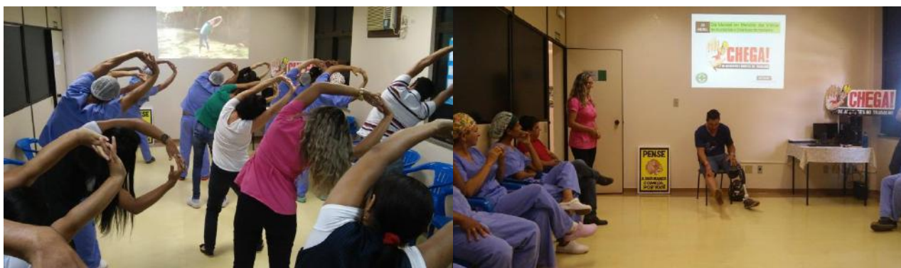
Ginastica laboral na palestra