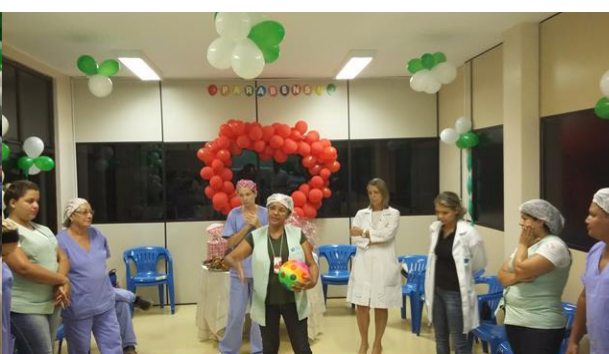
Colaboradores participam de dinâmicas