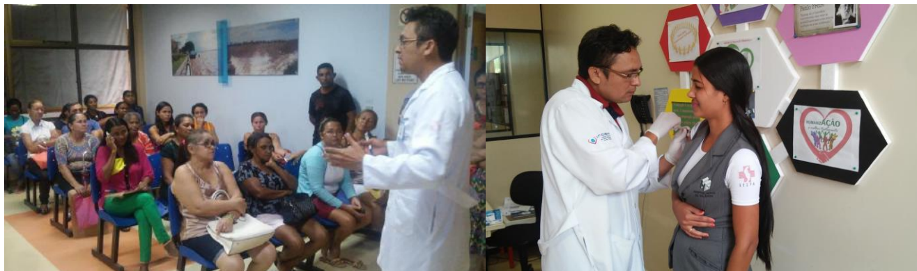
Palestras com os Usuários