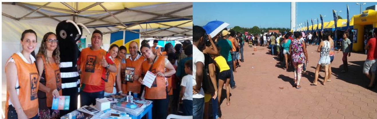
Equipe multidisciplinar do HGT na ação externa: “Saúde na Estrada” Ipiranga