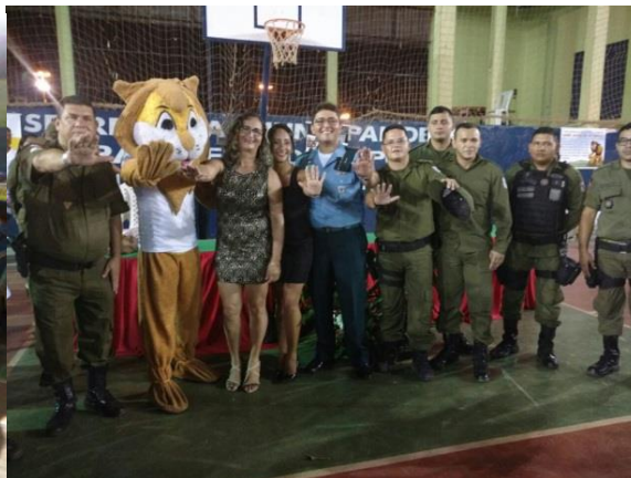
Ginásio Verner Kronbauer

Coordenadora do Grupo de Trabalho de Humanização do HGT apoia o programa junto com Equipe Militar.