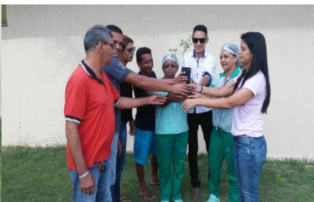
Usuários e colaboradores juntos a favor da conservação do meio