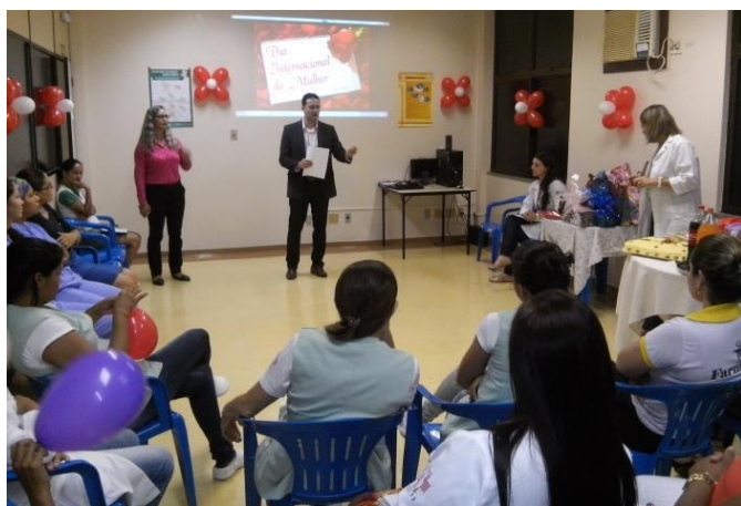
Homenagens no auditório do HGT