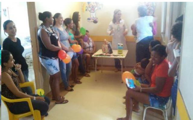
Sorteio de brindes e entrega de flores e mensagens para pacientes e acompanhantes do setor de internação.