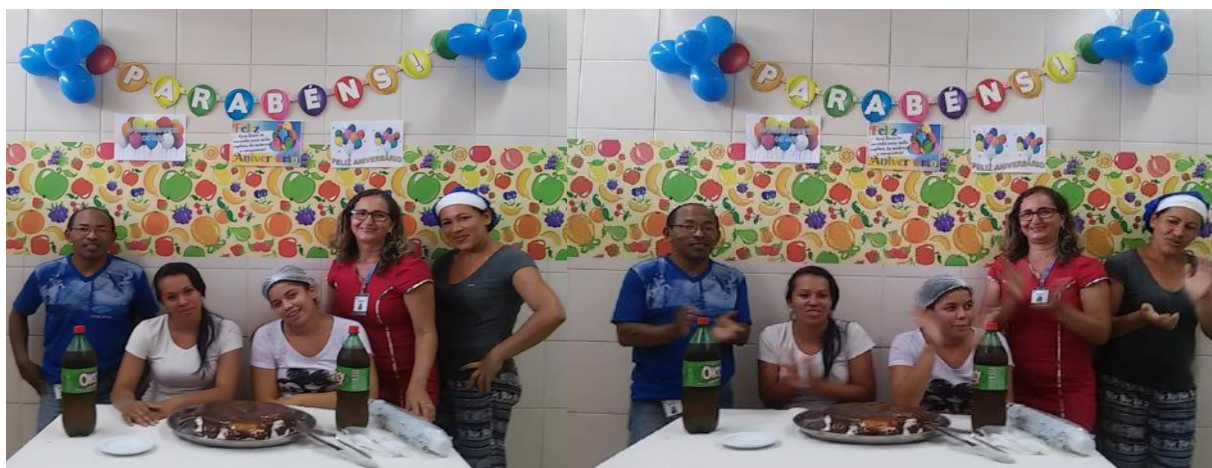
Comemoração dos aniversariantes do mês de novembro