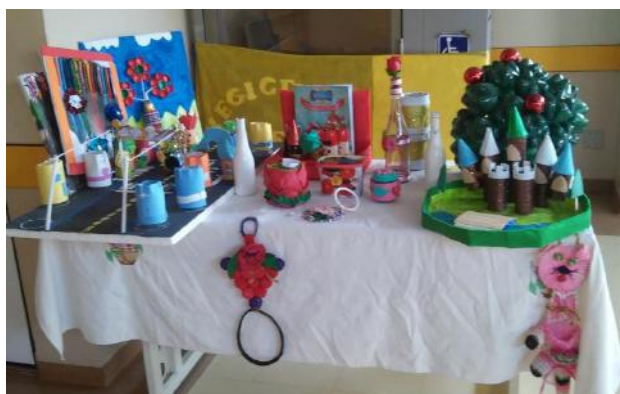
Exposição de material reciclado