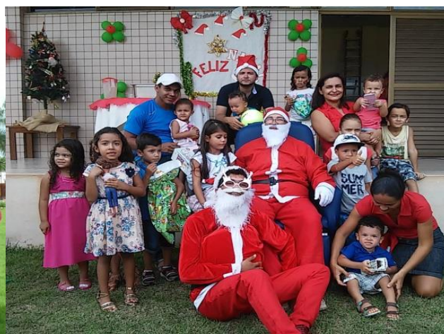
Crianças dos colaboradores do Hospital Geral de Tailândia são presenteadas.