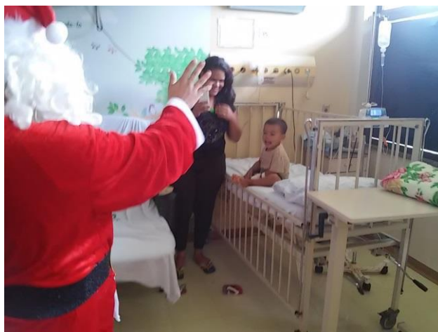
Criança recebe brinquedo no leito

Apresentação do coral dos alunos da Escola Municipal Maria Socorro Ricarte Lopes, através do projeto “Dia Feliz. Heróis Solidários” , corpo docente e discente junto com Grupo de Trabalho de Humanização do HGT, distribuíram brinquedos aos pequenos usuários internados.