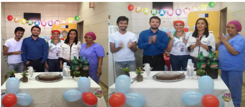
Colaboradores participam da comemoração do seu aniversário