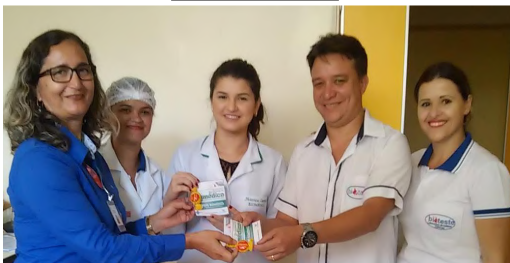
Momento da entrega da homenagem