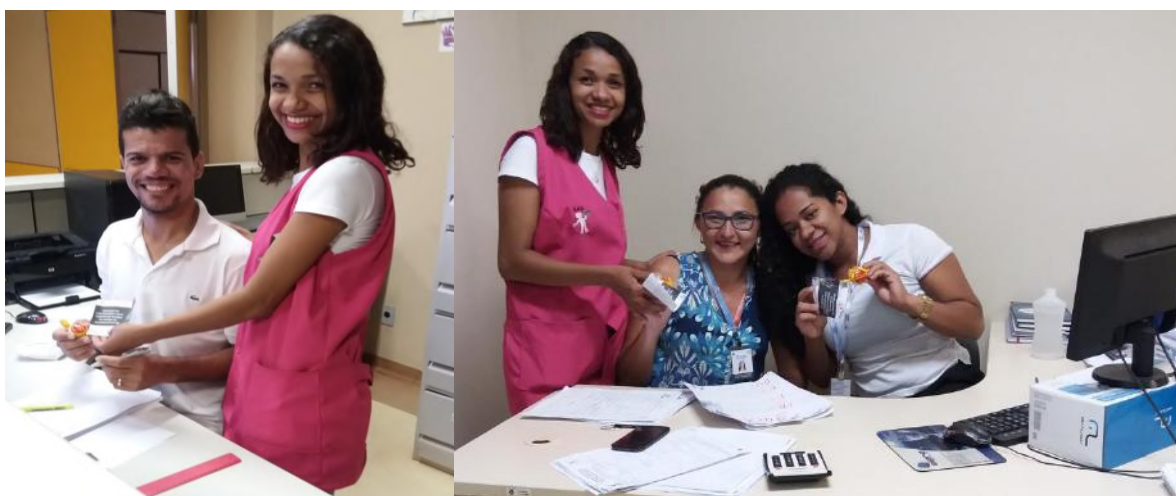
30 – Dia da Secretaria e Aux. Administrativo