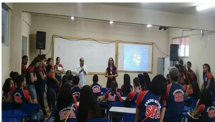
Pedagoga coord. GTH faz abertura da palestra.