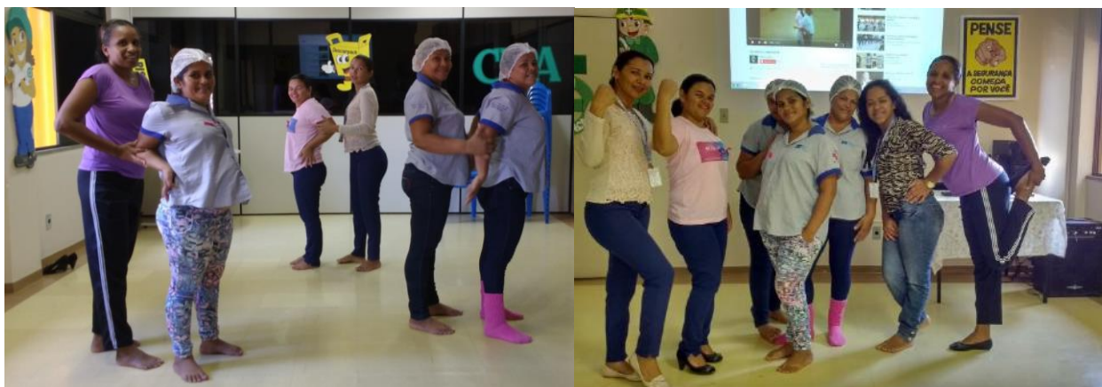
Colaboradores apoiam o projeto