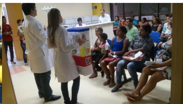
Recepção do Ambulatório