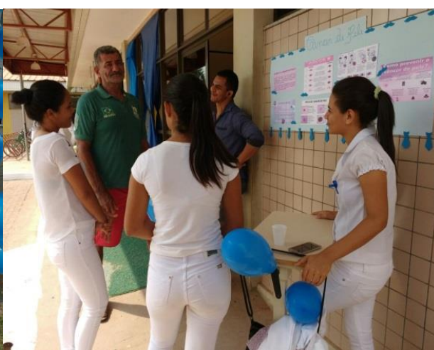
Orientações; Câncer de pele.