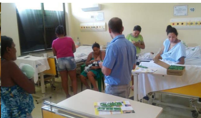
Orientações com as puérperas nos leitos.