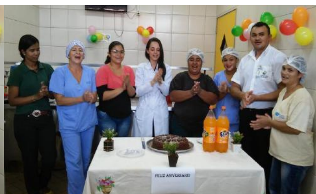
Colaboradores participam da comemoração do aniversário